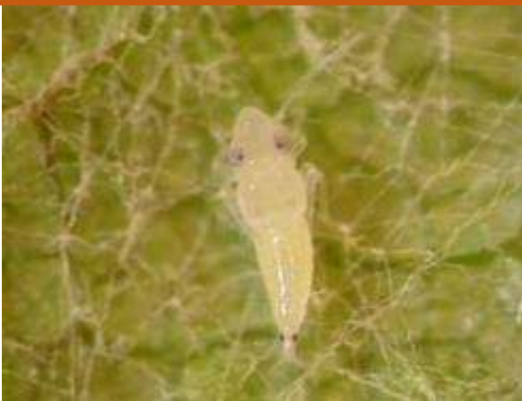
Obr. 1 Nymfální stádium N1 (od 15.5.) 17–19 BBCH