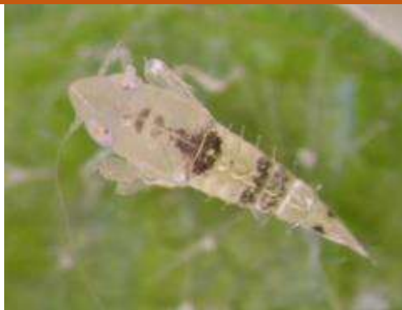
Obr. 4 Nymfální stádium N4 (od 25.6.) 55–57 BBCH