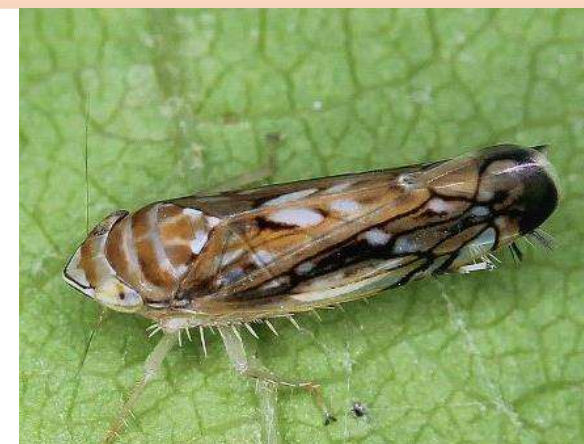
Obr. 6 Dospělec (od 15.6.) 53–99 BBCH

se může vyskytnout v polovině června společně s prvními dospělci. V tomto stádiu se stávají nymfy již infekční. Inkubační doba fytoplazmy v těle kříška je asi 1 měsíc, po uplynutí této doby se vektor stává infekčním až do konce jeho života.