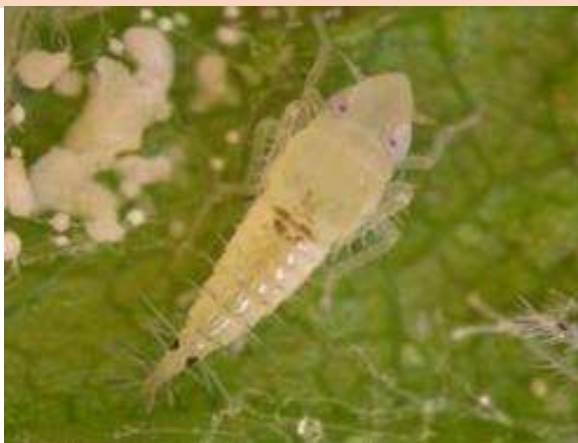
Obr. 3 Nymfální stádium N3 (od 15.6.) 53–55 BBCH