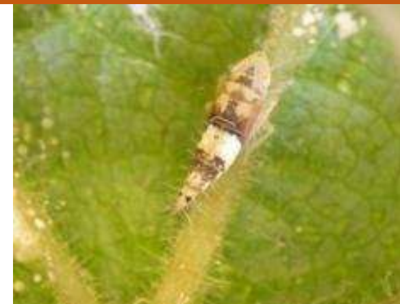
Obr. 5 Nymfální stádium N5 (od 5.7.) 57–60 BBCH