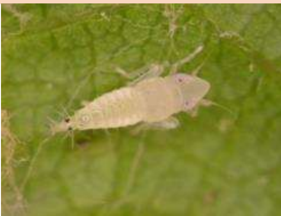
Obr. 2 Nymfální stádium N2 (od 1.6.) 19–53 BBCH